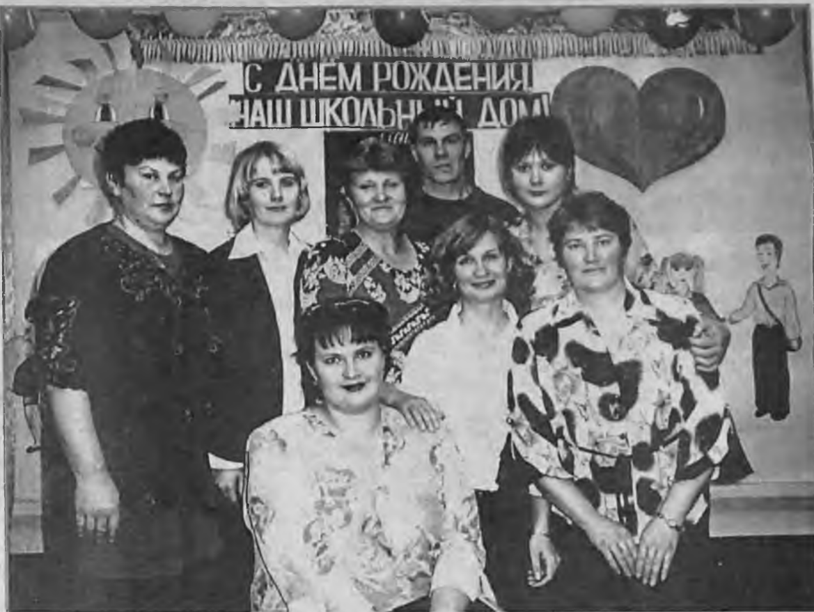
УЧИТЕЛЬСКИЙ КОЛЛЕКТИВ 2004 ГОДА.

В 1889 году в Александровке открылась церковно-приходская школа в одном из свободных крестьянских домов. Через четыре года построили новое здание