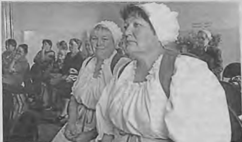
Участники и зрители.

8 июля в Александровке состоялась презентация проекта "Сибирские немцы Поволжья - диалог поколений"