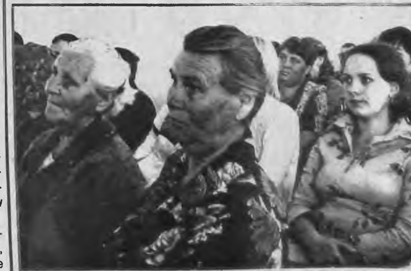
"Я ЛЮБЛЮ ЭТУ ЗЕМЛЮ."