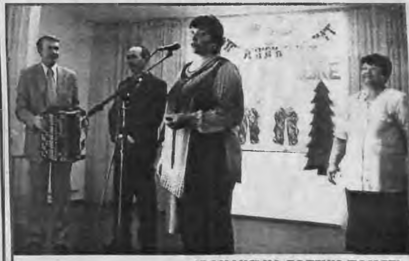
"РОМАНС" НА ДОЛГУЮ ПАМЯТЬ.