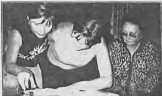
"СИАМСКИЕ БЛИЗНЕЦЫ" ПИШУТ ПИСЬМО В.В. ПУТИНУ.

Нашей малой родине - деревне Александровке - в нынешнем году исполнилось 139 лет. И хотя эта дата не считается "круглой", мы по традиции отметили день рождения родной деревни празднично.