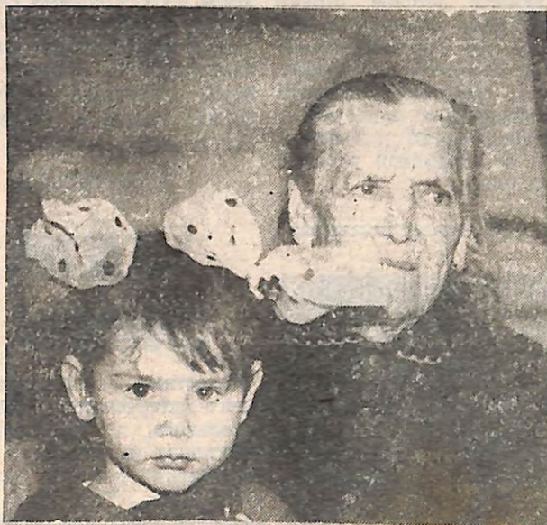
ЕКАТЕРИНЕ КАСПАРОВНЕ 84 ГОДА. ПОЗАДИ МНОГО СЛЕЗ И ГОРЯ, НО ВСЕ ЭТО ПЕРЕЖИТО, МОЖНО ПРИЛАСКАТЬ ПРАВНУЧКУ.

скуп на похвальное слово, он ответил коротко: