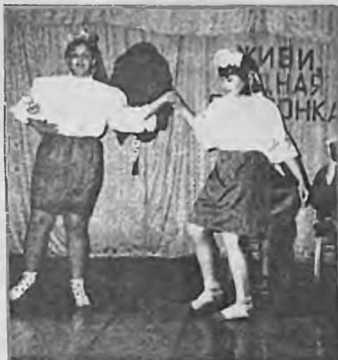
НОМЕР ХУДОЖЕСТВЕННОЙ САМОДЕЯТЕЛЬНОСТИ.

Программу открыли девушки-ведущие. Сегодня празднуем мы день рождения деревни, И на душе становится тепло. Богатую историей издревле, Трудом и праздниками славится село.