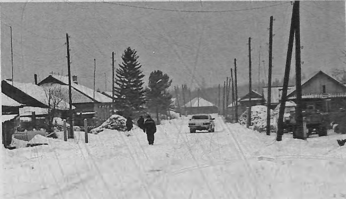
Александровка. Улица Центральная.