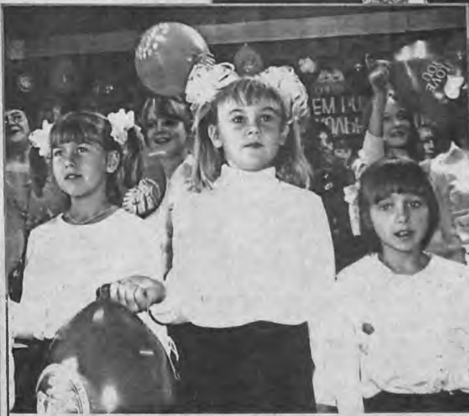
ПЕСНИ ШКОЛЬНОГО ДЕТСТВА.