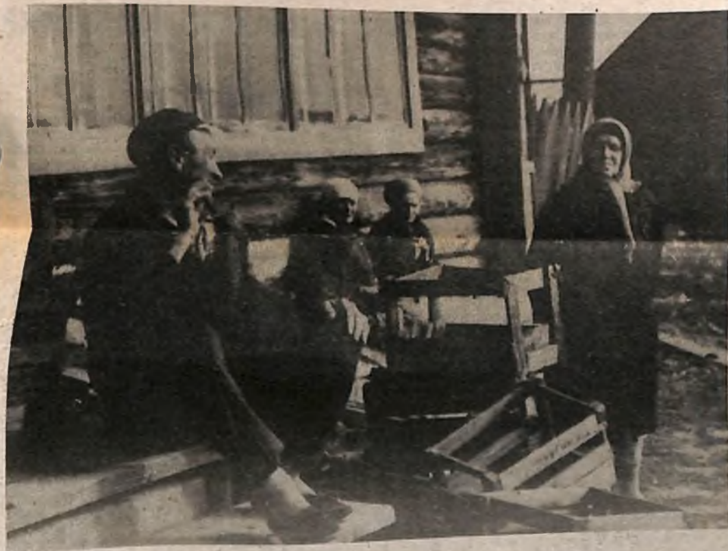
ДЕРЕВЕНСКИЙ БАЛАГУР.

Краснояр. проффотозыбл. — 1993 — №55 (сент.)