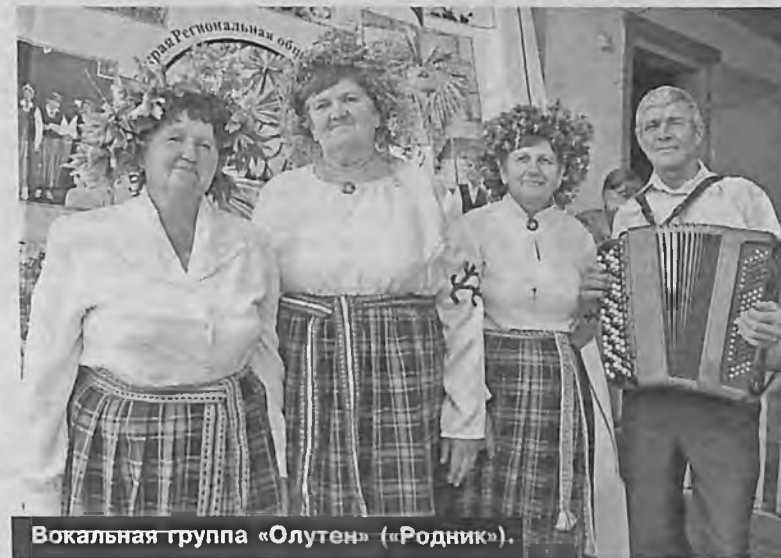
Вокальная группа «Олутен» («Родник»).