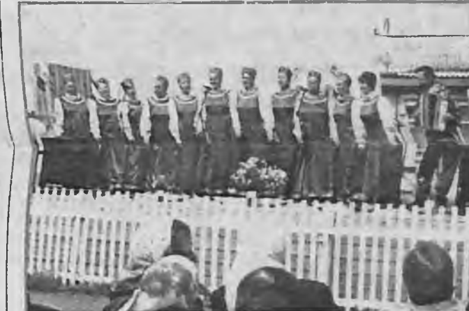
НА СЦЕНЕ - ГРУППА "ГОРНИЦА".