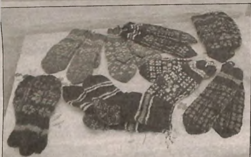
Те самые, непростые варежки.

Латгалы, населявшие восточную часть современной Латвии по правому берегу Даугавы, упоминаются в русских источниках с XI века. От этой древней народности, давшей название латышскому народу, и «появились» латгалцы, в результате особых исторических и географических условий более тесно связанные со славянскими народами. Меж тем «славяненность» Латгалии в Латвии всегда воспринималась слабо.