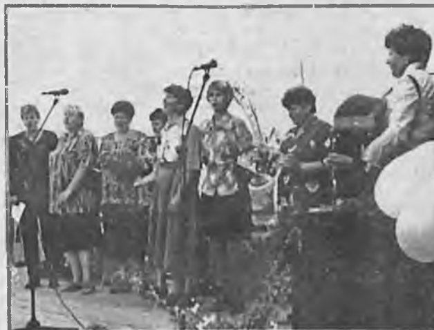
ВЫСТУПАЮТ СОСЕДИ - УДАЧИНЦЫ.

зван так в честь уроженца Большого Улуя, Героя Советского Союза В.И. Давыдова. Он был участником штурма Берлина и его цитадели - рейхстага.