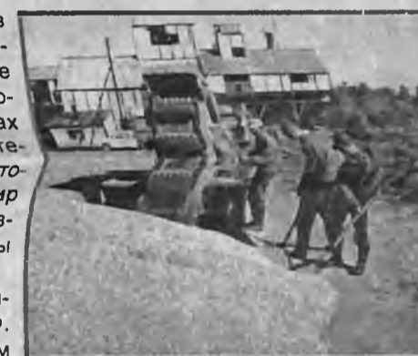
ИДЕТ ЗЕРНО НОВОГО УРОЖАЯ.