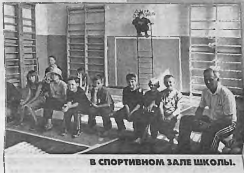
В СПОРТИВНОМ ЗАЛЕ ШКОЛЫ.

Набережная без асфальта, полотно улицы даже не отсыпано. А может быть, и благоустроивалось оно, да давно. После дождя здесь стояли лужи, и возле домов картина была, мягко говоря, несвежей. Щепки, бревна, какие-то завалы техни-