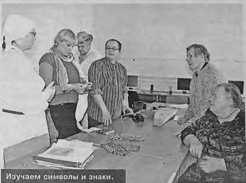
Изучаем символы и знаки.

Целью приезда гостей из Прибалтики – этой небольшой культурной экспедиции было проведение новогодних каникул латгальцев в Сибири по обширной программе: с лекциями, обрядами, знакомством с художественным творчеством современной Латгалии, аудиозаписью чтения носителями языка отрывков литературных произведений, свободного общения на бытовые темы, обмен информацией о событиях в России и Латгалии.