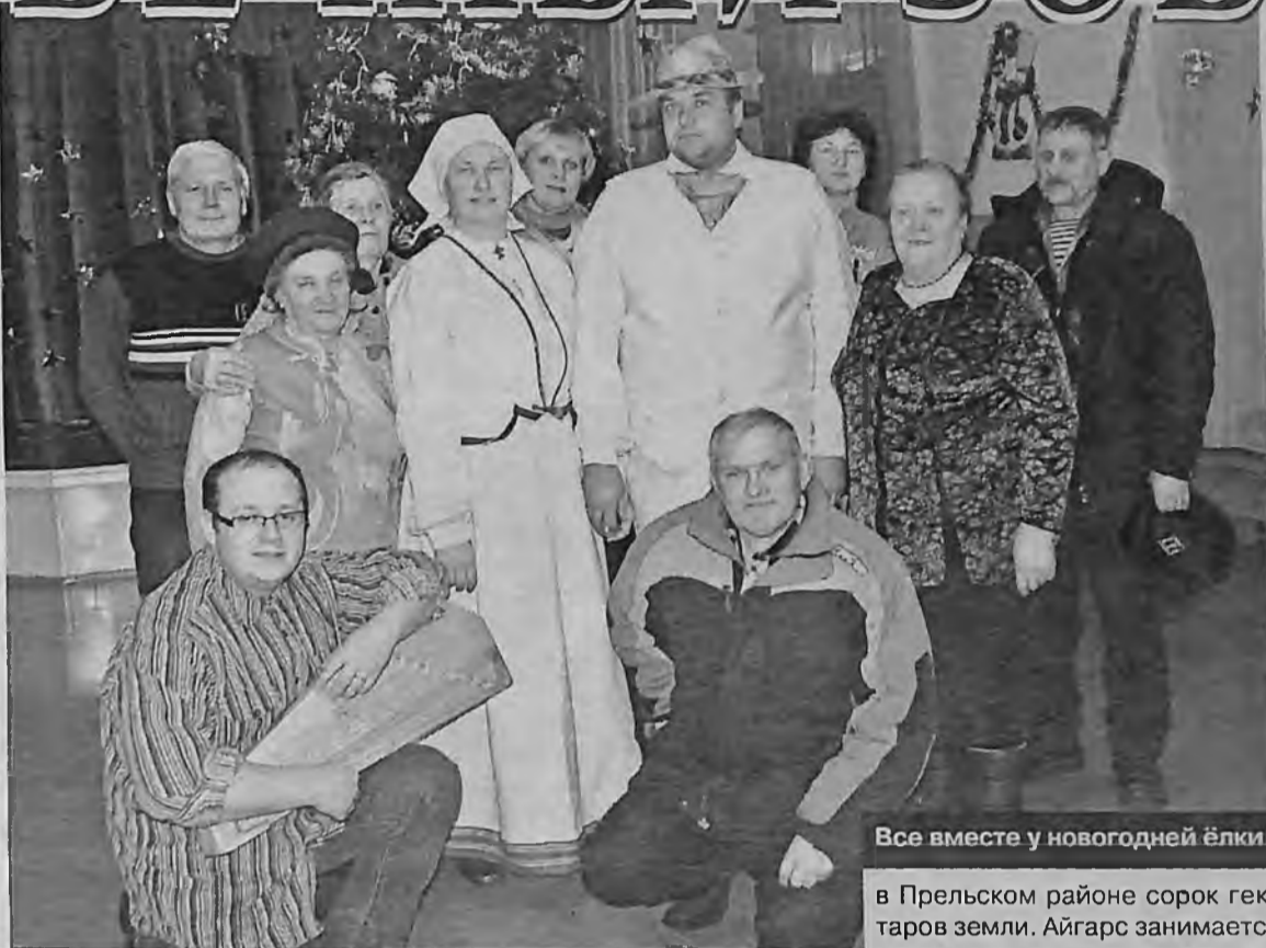
Все вместе у новогодней ёлки.

Целью приезда гостей из Прибалтики – этой небольшой культурной экспедиции было проведение новогодних каникул латгальцев в Сибири по обширной программе: с лекциями, обрядами, знакомством с художественным творчеством современной Латгалии, аудиозаписью чтения носителями языка отрывков литературных произведений, свободного общения на бытовые темы, обмен информацией о событиях в России и Латгалии.