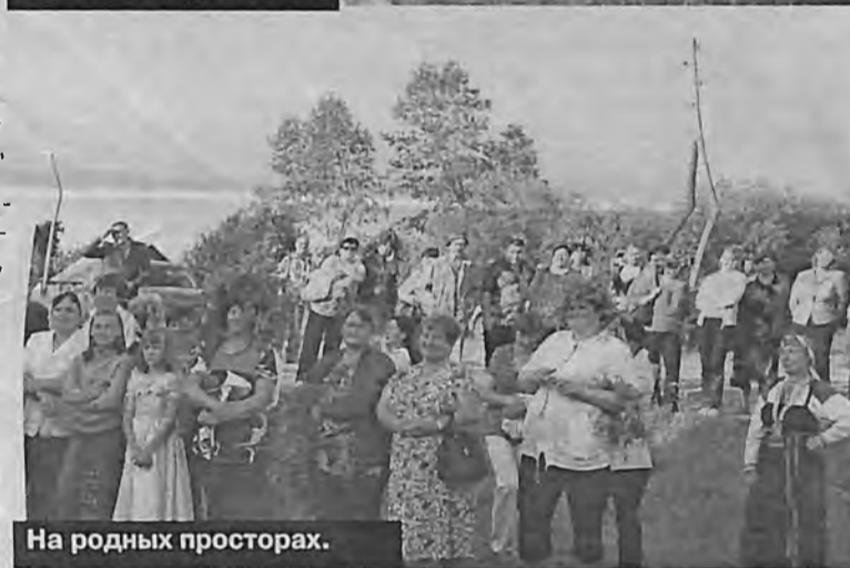
На родных просторах.