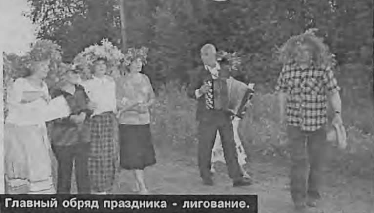
Главный обряд праздника - лигование.