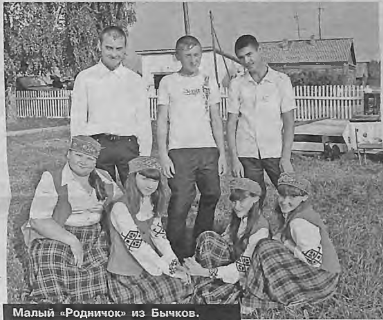
Малый «Родничок» из Бычков.