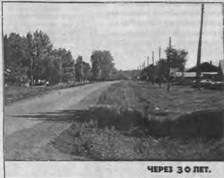
ЧЕРЕЗ 30 ЛЕТ.

Шли годы, постепенно страна поднималась из разрухи, малые хозяйства стали на ноги, баганы и постепенно прекратили свое существование. Отсутствие дорог, связи, школ и других благ вынудило население тяжелых деревень покидать обжитые места и переезжать поближе к более развитым селам.