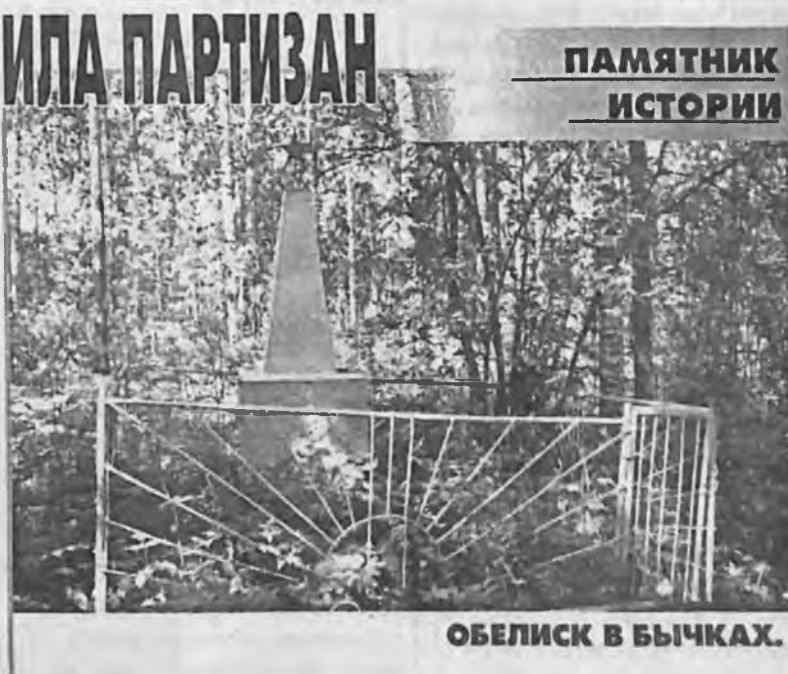
ОБЕЛИСК В БЫЧКАХ.