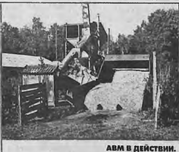
АВМ В ДЕЙСТВИИ.