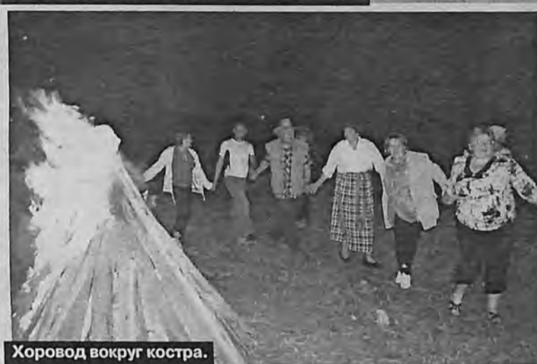
Хоровод вокруг костра.