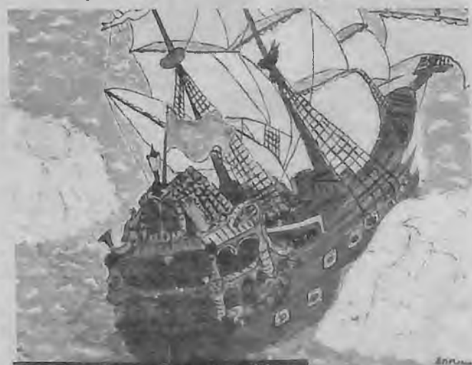
Рисунок Ромы Логунова, 11 кл.