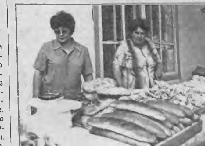
ТОРГОВЫЕ РЯДЫ В.И. БОРИСОВОЙ.