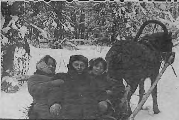
На методобъединение - в Елгу.

Енисейского педагогического института. Жил в студенческом общежитии, в учёбе затруднений не было, но из-за материальных трудностей приходилось работать. По ночам разгружали баржи в Енисейском порту: взваливали на плечи 70-килограммовые мешки и бегом относили, пока шли за следующим мешком, отдыхали. Жилось очень трудно... Даже хотел бросать институт, ведь устраиваются как-то другие в жизни... Но родители не разрешили, вовремя остановили от опрометчивого шага.