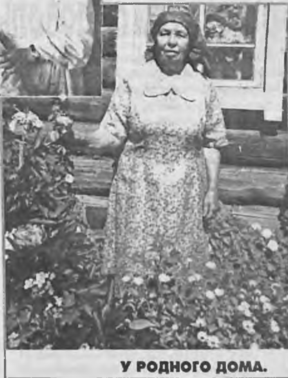
У РОДНОГО ДОМА.