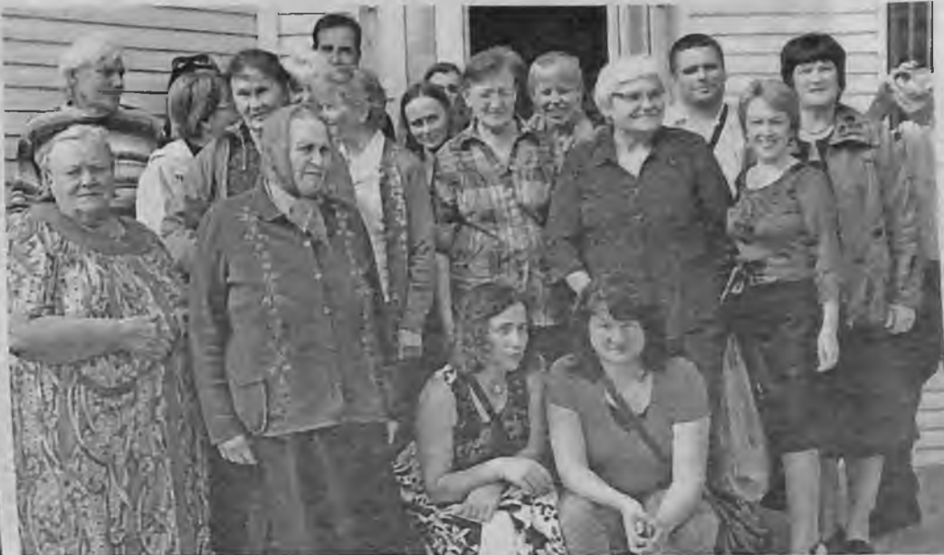
Участники международной конференции.

ной организации "Центр латгальской культуры" Красноярского края. Ведь благодаря и его многолетнему труду они в очередной раз смогли собраться на нашей земле. Делегация из 29 человек - люди неравнодушные к своей культуре, родному языку. Половина из них приехали из Латвии и США, остальные из Кемеровской области и разных уголков Красноярского края. Подобные конференции уже проходили в Латвии, Германии, Польше, Санкт-Петербурге.