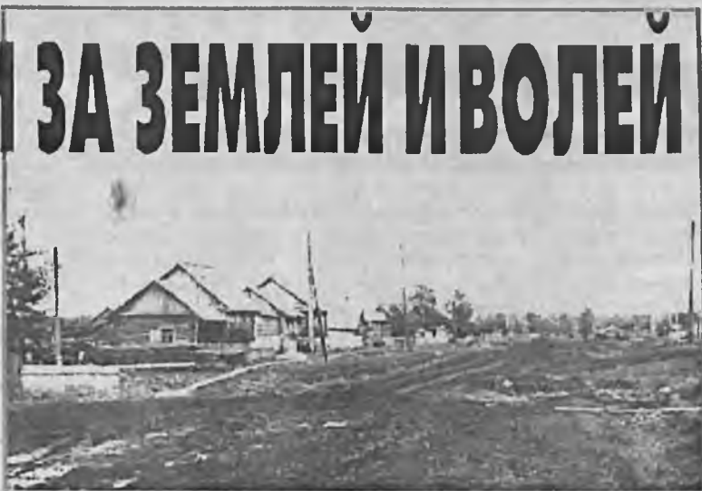
ТАКОЙ БЫЛА ДЕРЕВНЯ БЫЧКИ (70 - е годы).

Быстрое развитие зачулымских деревень привело к тому, что с 1 января 1912 года Большеулуйскую волость разделили на четыре. Одной из них стала Зачулымская (Ново - Новоселовская). Тогда же был открыт Ново - Новоселовский Троицкий церковный приход. В него входило семь деревень. Церкви и школы в приходе не было. Молитвенный дом построили в 1913 году, службу в котором проводили священник и псаломщик. В ведении прихода имелись земли - 5 десятин усадебной, 4 пахотной, 6 сенокосной и 95 под горелым лесом. Вся земля находилась в полтора верстах от Ново-Новоселово.