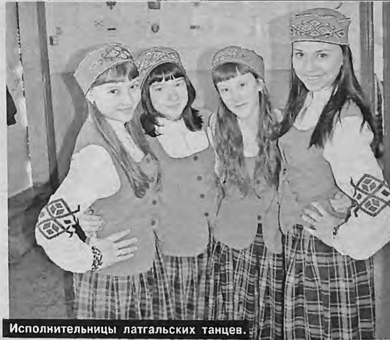
Исполнительницы латгальских танцев.

«обрусевших» латгалцев у нас в районе предостаточно.