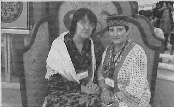
На форуме женщин

В первый день мы побывали на экскурсии по Казани: посетили национальный музей Татарстана, побывали в Кремле, увидели одну из главных святынь Казани - Кол Шариф. Во время экскурсии узнали историю строительства старейшей мечети Марджони. Оказывается, разрешение на строительство этой мечети было получено от самой императрицы Екатерины II, которую и в наше время татары с любовью зовут не иначе, как Эби падша. После экскурсии