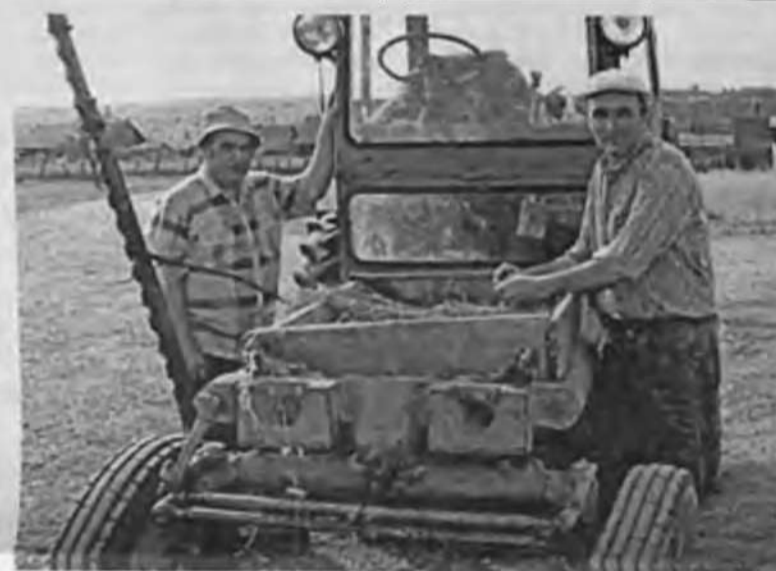
Пора на покос.