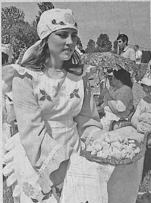
Национальное угощение «Чак-чак».

2014 год в нашем районе выдался щедрым на юбилеи. Их празднуют жители сёл, деревень. 21 июня юбилей Елги отметили на традиционном празднике "Сабан туй". Торжество приурочили к 85-летию дню рождения татарской деревни, которую искренне любят те, кто живут здесь