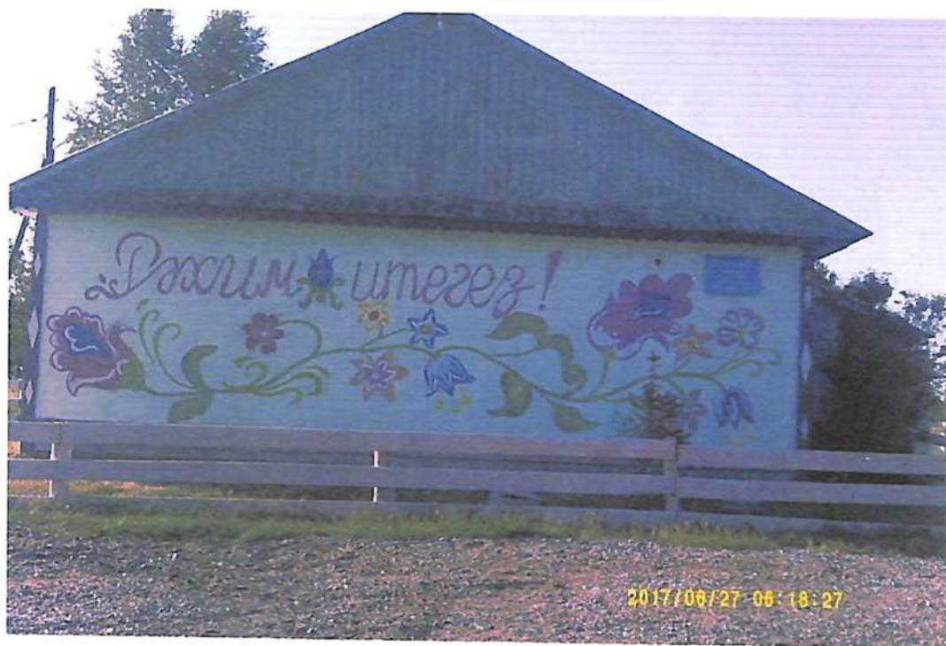
Елгинский сельский Дом культуры