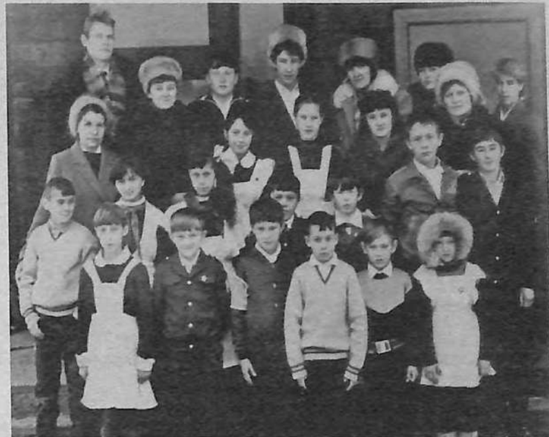
Учителя и ученики