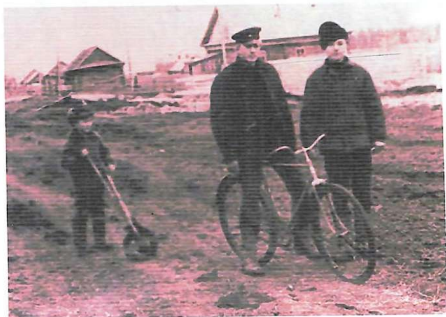
На заднем плане Елгинская начальная школа. 1970-ыегоды.