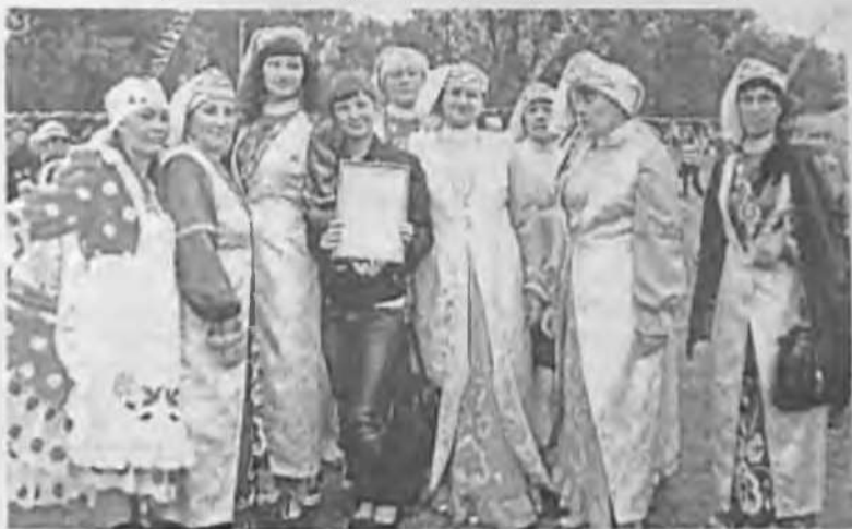
Делегация из Елги.

В Красноярске состоялся традиционный татарский народный праздник Сабантуй