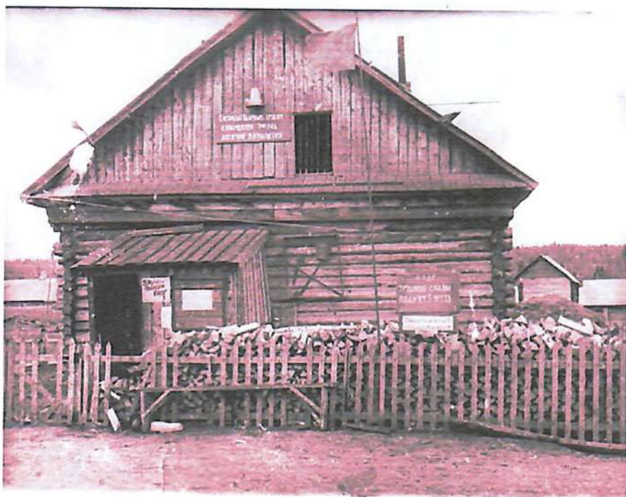
С 1970 года по 1983 год. Старый клуб.