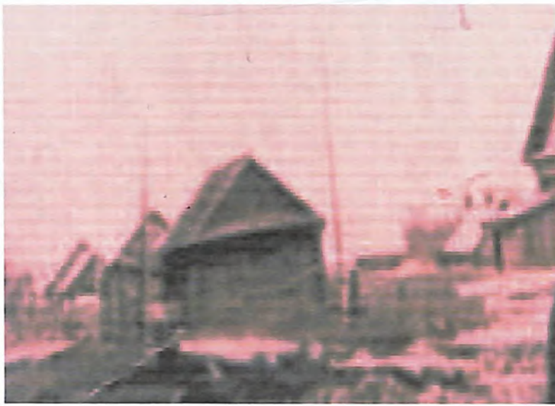
Старая контора 1970 ые– годы...