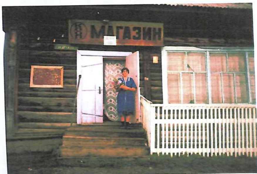
Елгинский магазин 1980 –ые годы