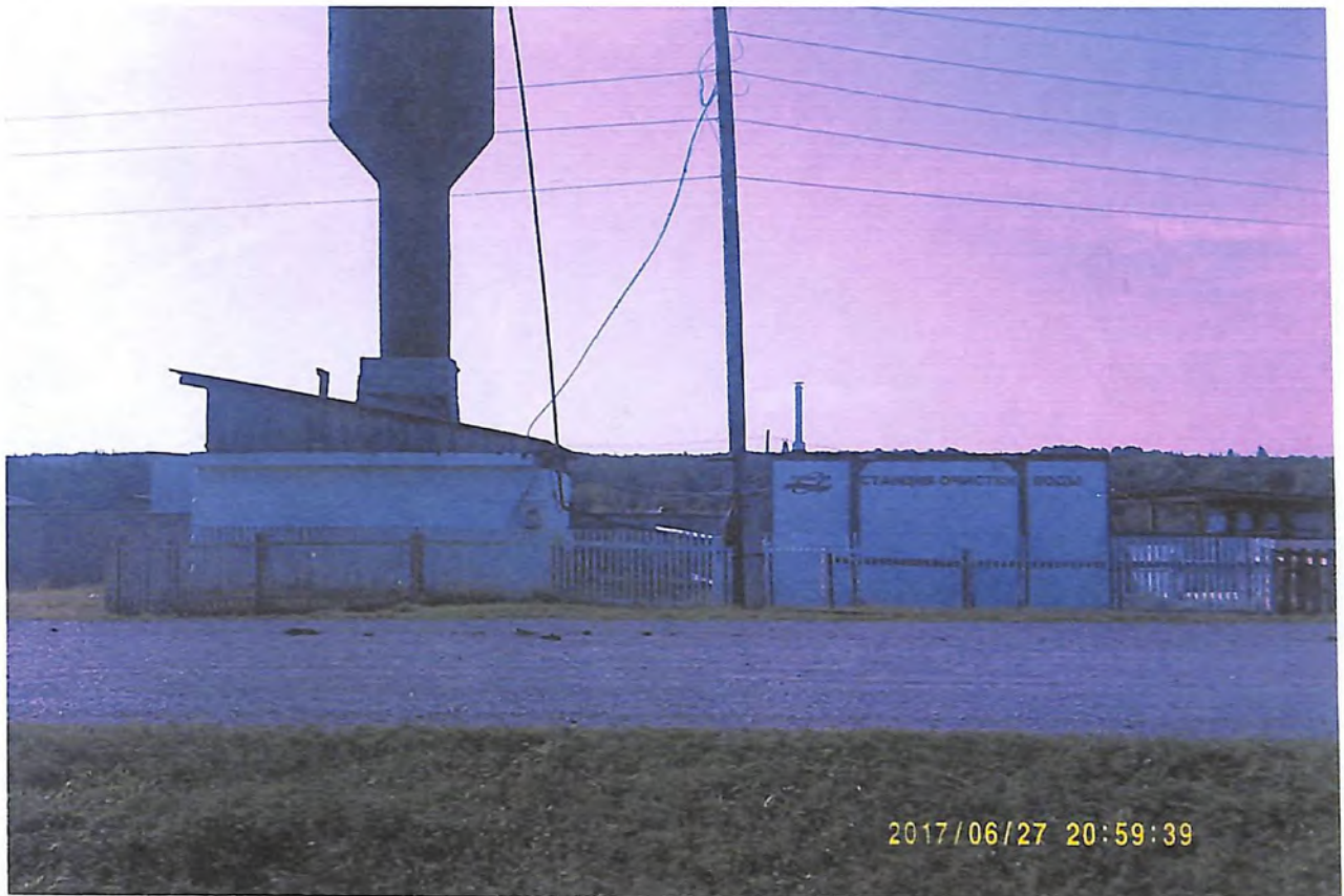
На этом месте, в настоящее время, построена водонапорная башня и станция очистки воды.