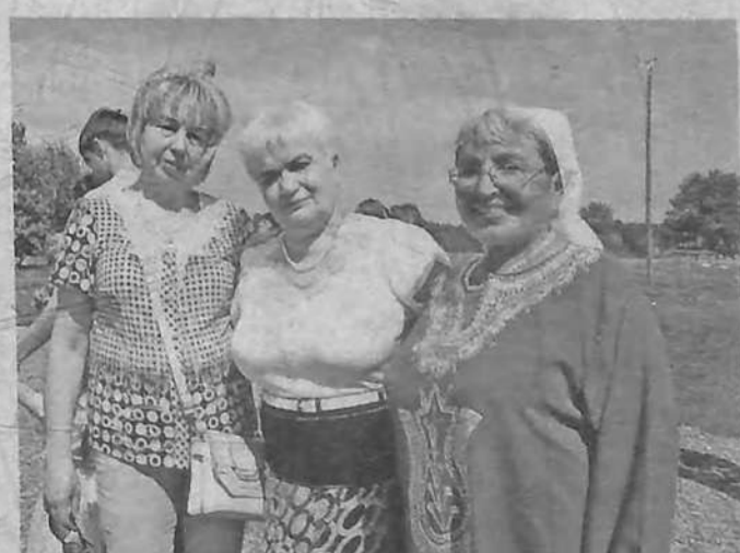
Гости Елги, которые здесь родились и выросли.