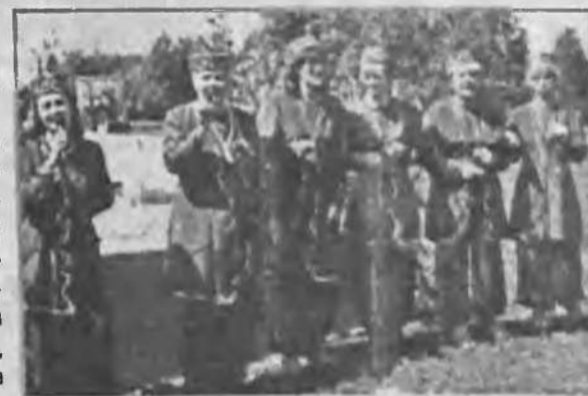
ВОКАЛЬНАЯ ГРУППА "ИДЕЛЬ".