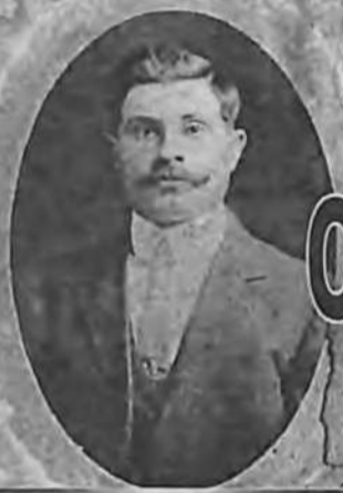
Ф. Брыжатый. Снимок начала XX века.

делам к соседям. Но никогда не думала, что их пути пересекутся.