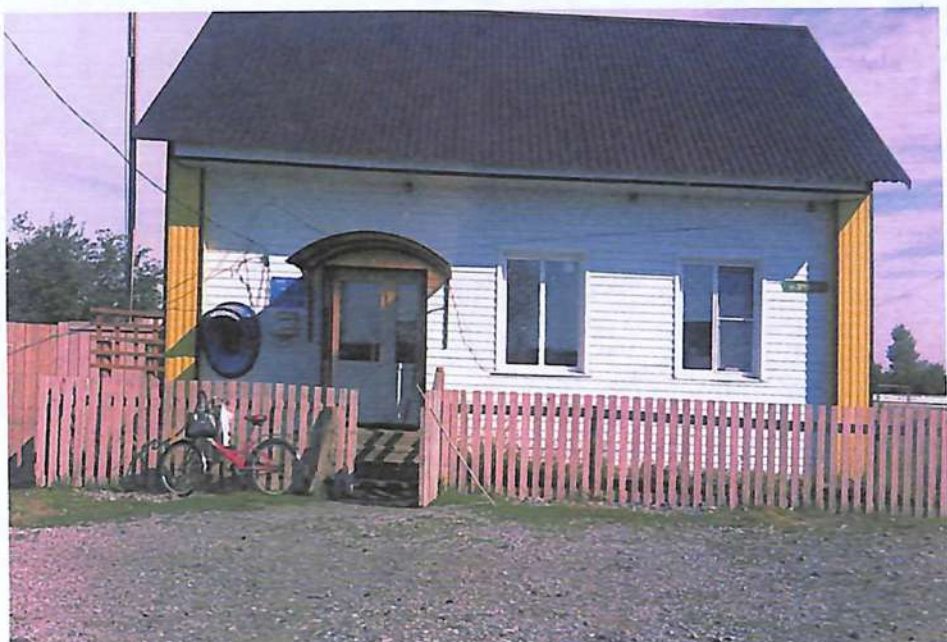
Елгинский магазин. 2017г.