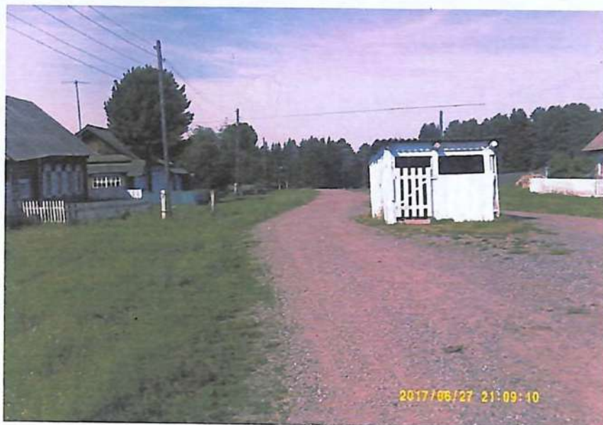
С колодцев доставали воду.....