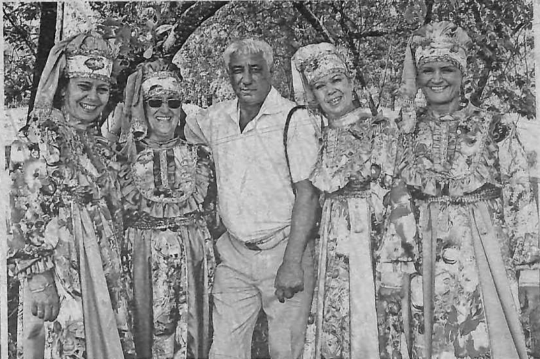
Вокальная группа «Дуслык» - «Дружба».

В Елге не так давно появилась своя мечеть, и сегодня все мусульманские праздники и обряды совершаются в этом скромном помещении обычного дома.