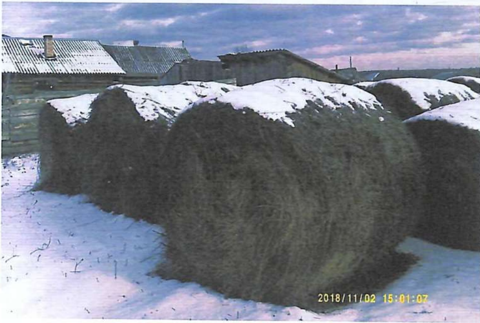
Сено срулоненное современной техникой.