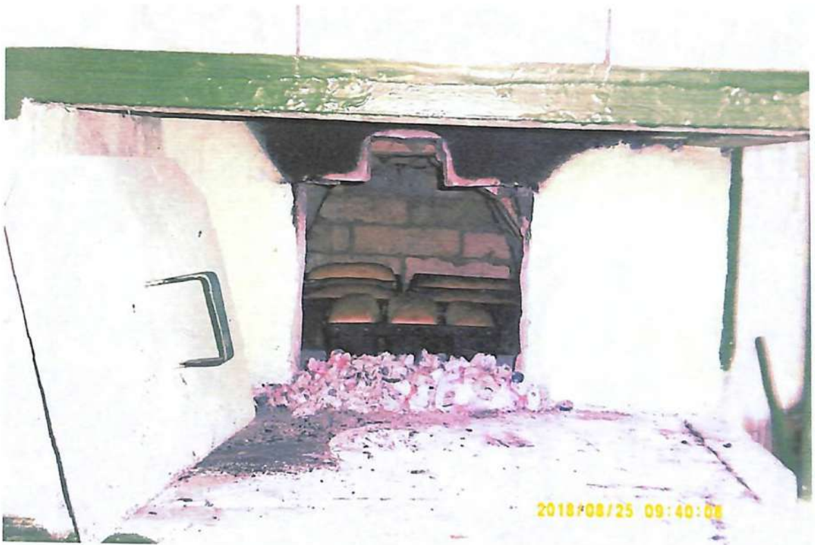
Ничем не сравнить аромат испеченного хлеба в русской печи.