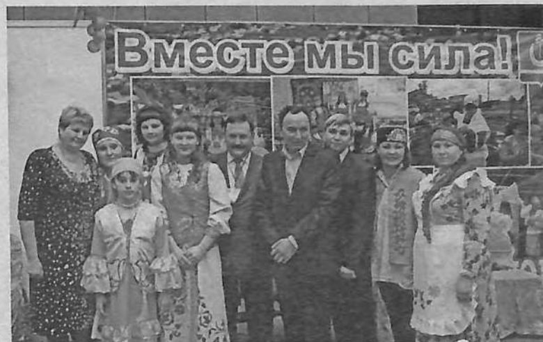
Делегация из Большеулуйского района.