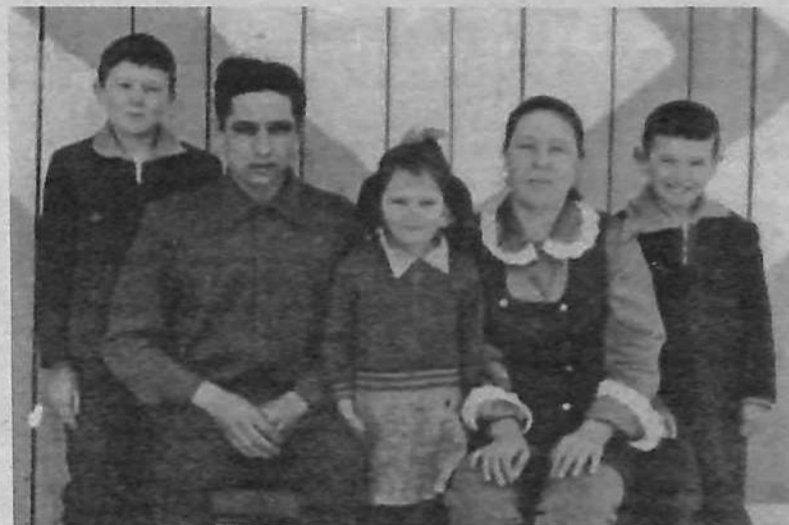
Вся семья в сборе

В семейном архиве Гимрановых есть ещё очень интересная бумага: сохранный расписка от 10 марта 1982 года.