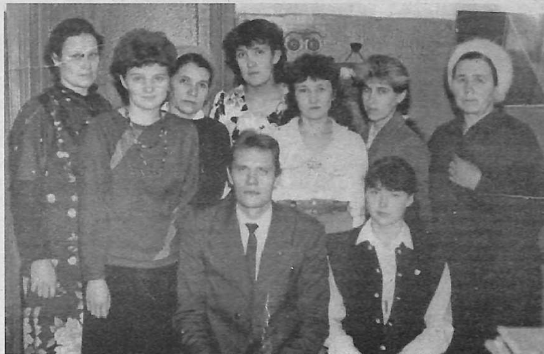
Коллектив Елгинской школы. Конец 80-х годов