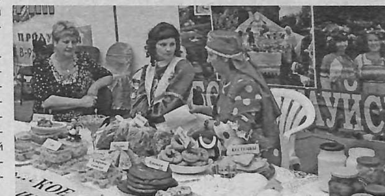
Хлебосольное подворье елгинцев.