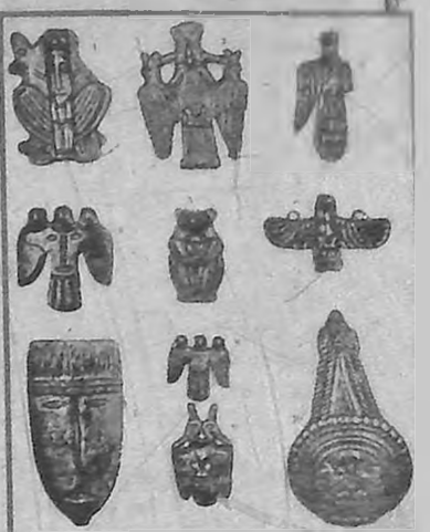
БРОНЗОВЫЕ ИЗОБРАЖЕНИЯ ЖИВОТНЫХ И ЧЕЛОВЕКА.