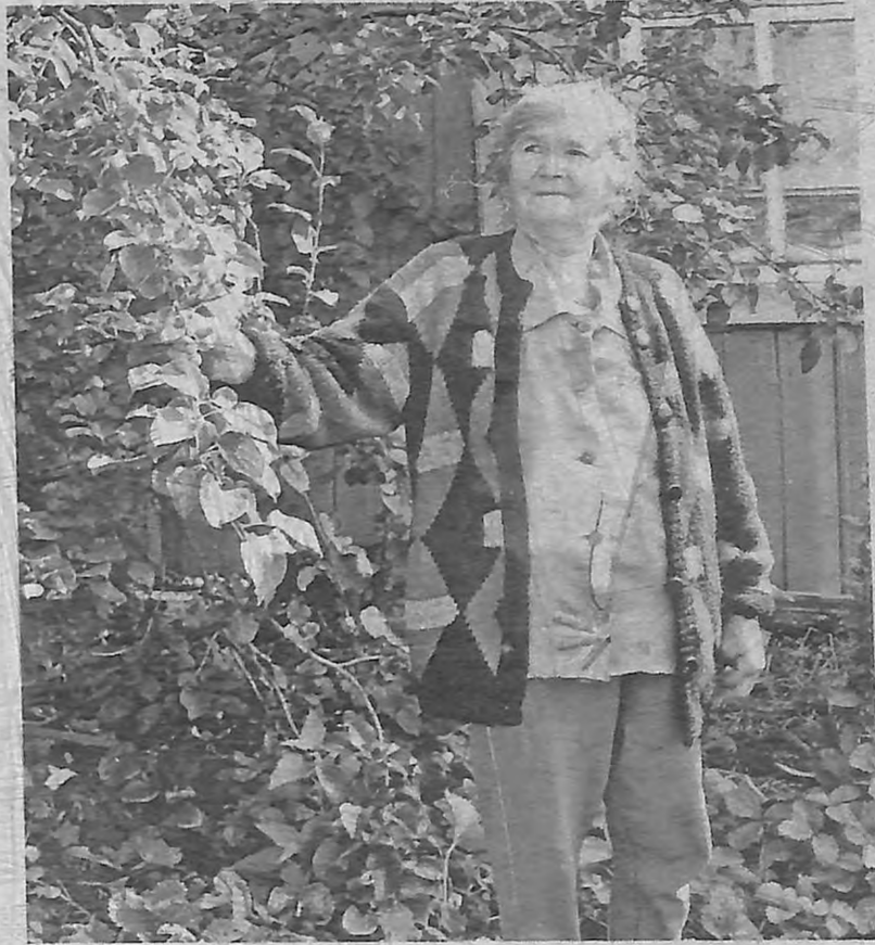
На приусадебном участке. Сентябрь, 2015

с огорода - всё это заботливая мама отправляла в город. А сама занималась обычными сельскими делами. Даже дрова на зиму запасала сама.