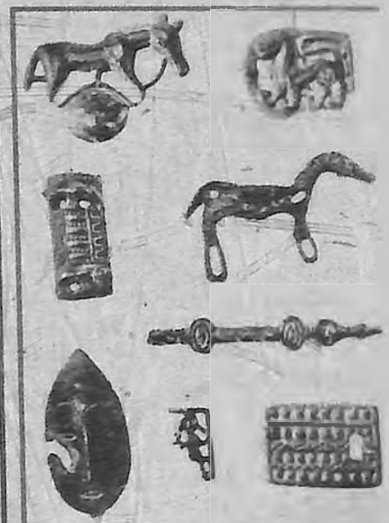
ЗАСТЕЖКИ, ПРЯЖКИ, УКРАШЕНИЯ. СЛЕВА ВНИЗУ - БРОНЗОВОЕ ЛИТОЕ ИЗОБРАЖЕНИЕ ЛИЦА ЧЕЛОВЕКА