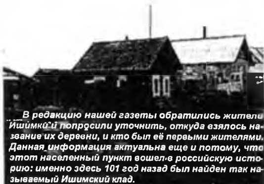
В редакцию нашей газеты обратились жители Ишимки и попросили уточнить, откуда взялось название их деревни, и кто был её первыми жителями. Данная информация актуальна еще и потому, что этот населенный пункт вошел в российскую историю: именно здесь 101 год назад был найден так называемый Ишимский клад.

Представители «Енисейской партии по образованию участков вдоль линии Сибирской железной дороги» указывали, что удобной земли в будущей деревне было 2 197, 5 десятины (1 гектар — 0,153 десятины), неудобной — 1723, 3 десятины. То есть общая площадь составляла 3921 десятину. И затем делался такой вывод: «На участке может быть водворено 138 душ мужского пола». Отметим — землю тогда выделяли только на мужчин, независимо от возраста. Женщин в переселенческих участках могло быть сколь-