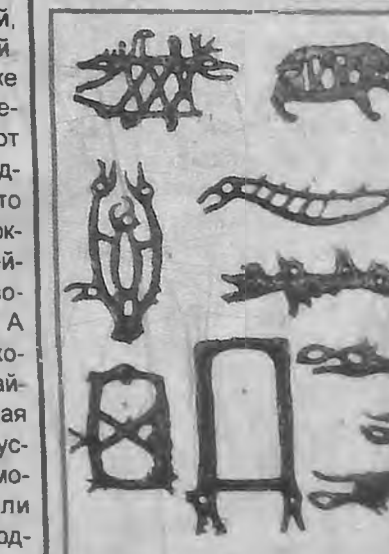
ГРУБОЕ АЖУРНОЕ ЛИТОЕ ИЗОБРАЖЕНИЕ