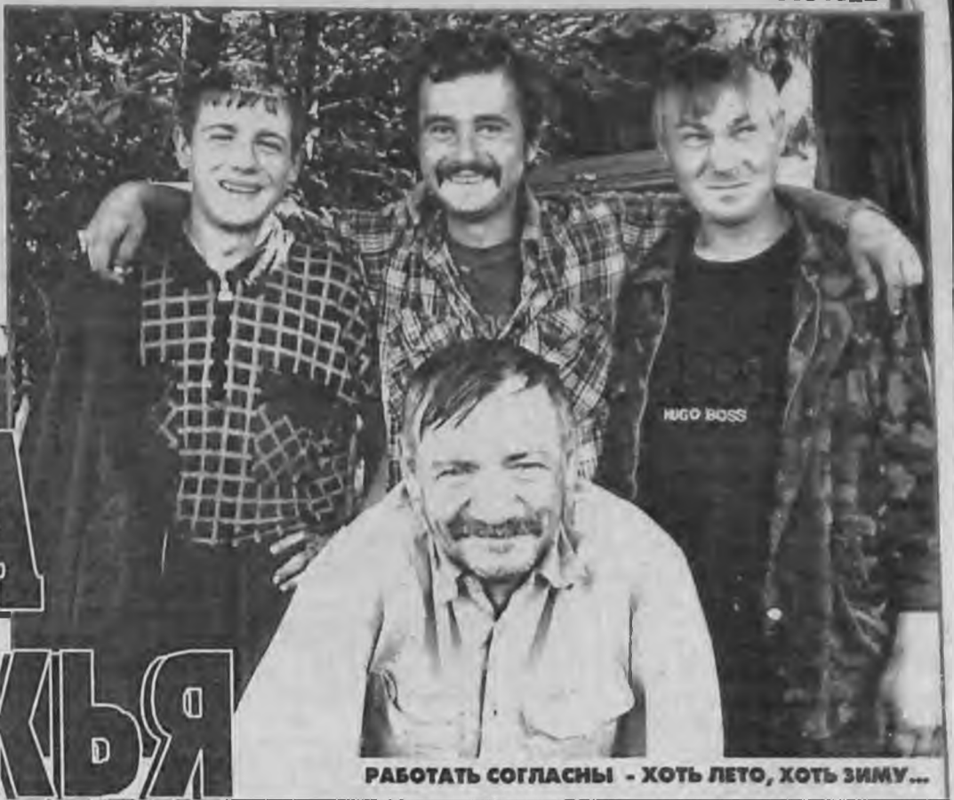
РАБОТАТЬ СОГЛАСНЫ - ХОТЬ ЛЕТО, ХОТЬ ЗИМУ...

У понтонового моста на правом берегу Чулыма мы взяли в свою машину двух женщин. Было видно, едут издали, в руках веселые сумки. Пассажиры торопились в Ишимку - интуитивно взяли тех, кто был нам нужен, потому что мы направлялись именно в эту деревеньку.