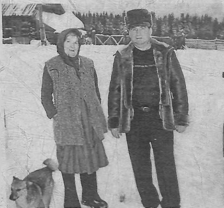
С сыном, с. Удачное