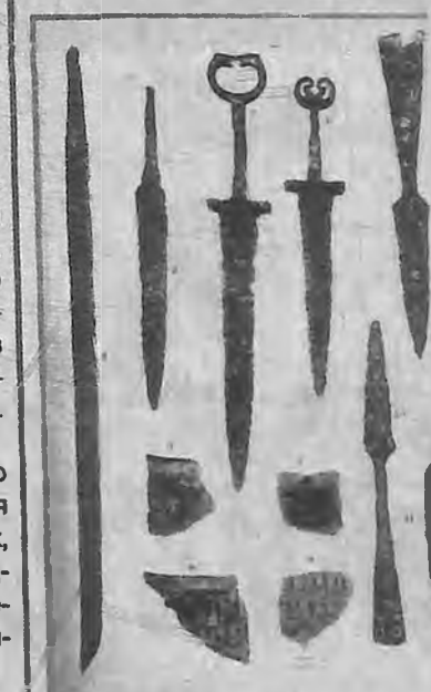
ЖЕЛЕЗНЫЕ КИНЖАЛЫ И КЛИНКИ, ВНИЗУ ОБЛОМКИ КЕРАМИЧЕСКОГО СОСУДА