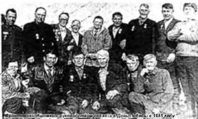
Фронтвики Ишимки в руководстве совхоза «Днепр» победы в 1915 году.

Нужно было стриться разрабатывать и засеивать пашню, растить детей. Характерно, что здешние переселенцы были людьми очень трудолюбивыми. Об этом свидетельствуют и сухие строчки результатов Всероссийской сельскохозяйственной и земельной переписи 1917 года. Они были опубликованы в Красноярске в 1921 году. Документы свидетельствуют, что в переломное для нашей