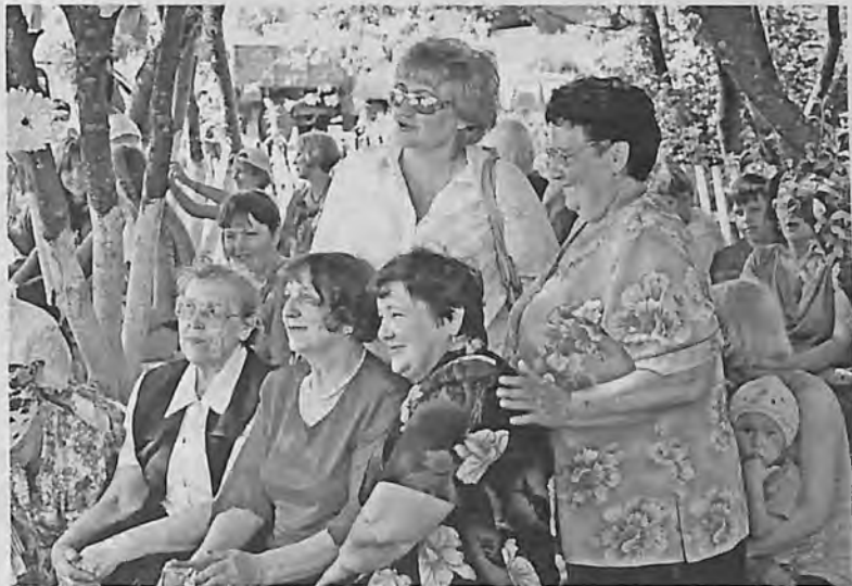
На юбилейном торжестве.