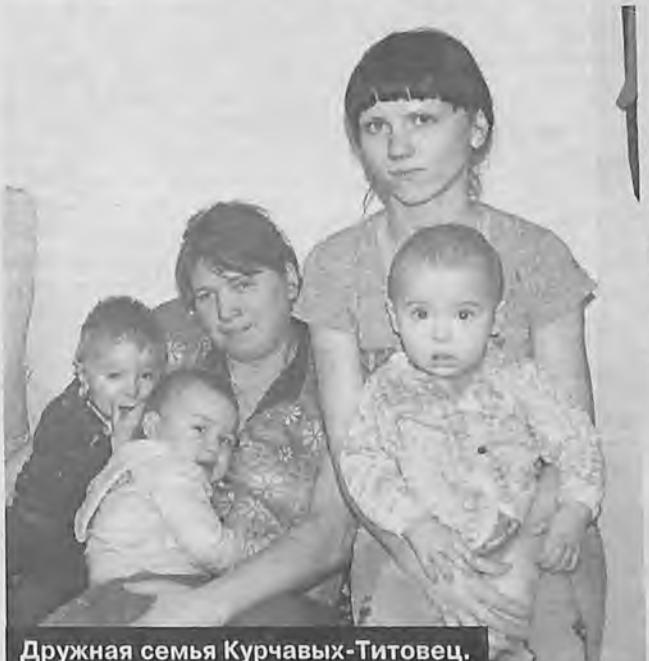
Дружная семья Курчавых-Титовец.