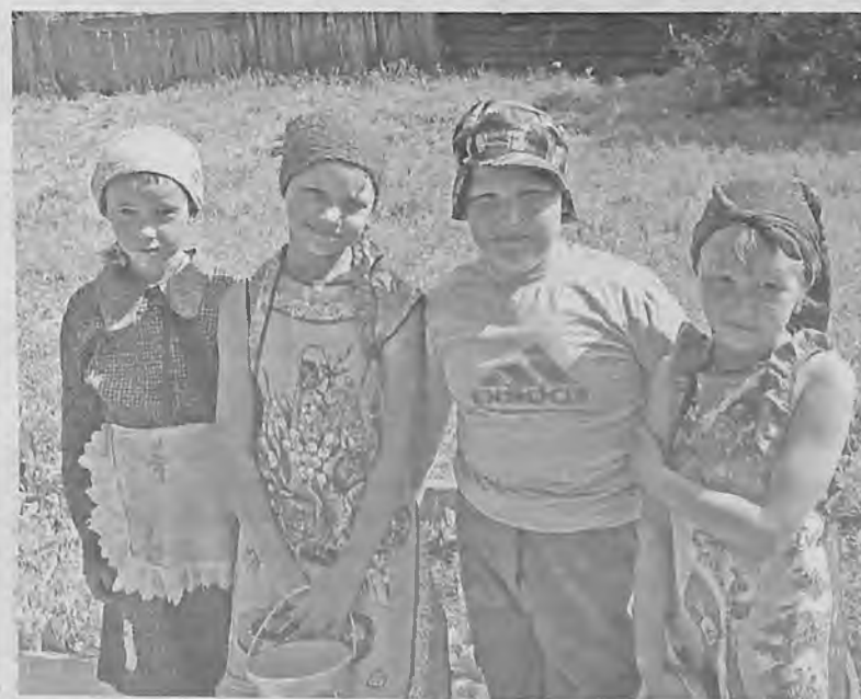
Юные артисты из Карабановки.