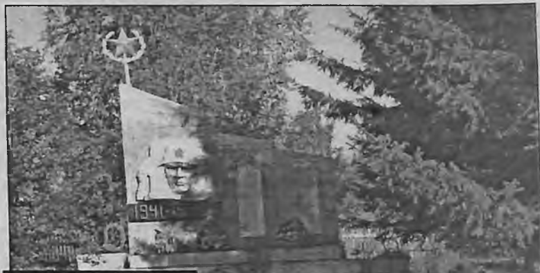
Обелиск в Удачной.