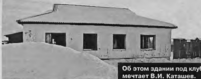
Об этом здании под клуб мечтает В.И. Каташев.