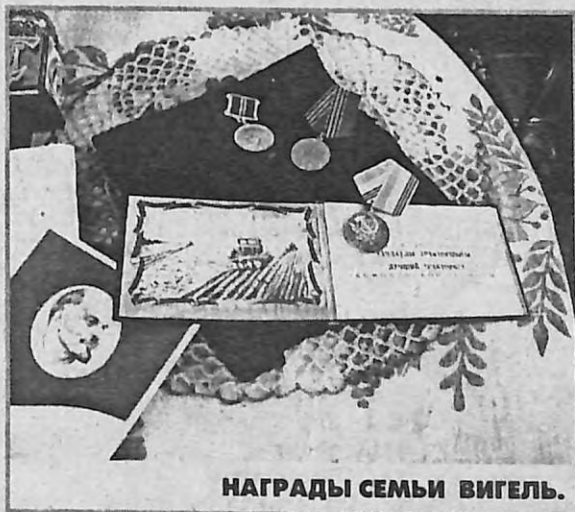
НАГРАДЫ СЕМЬИ ВИГЕЛЬ.