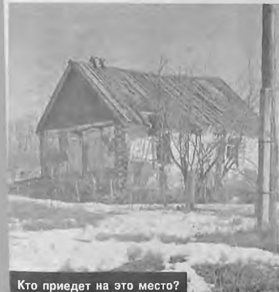
Кто приедет на это место?