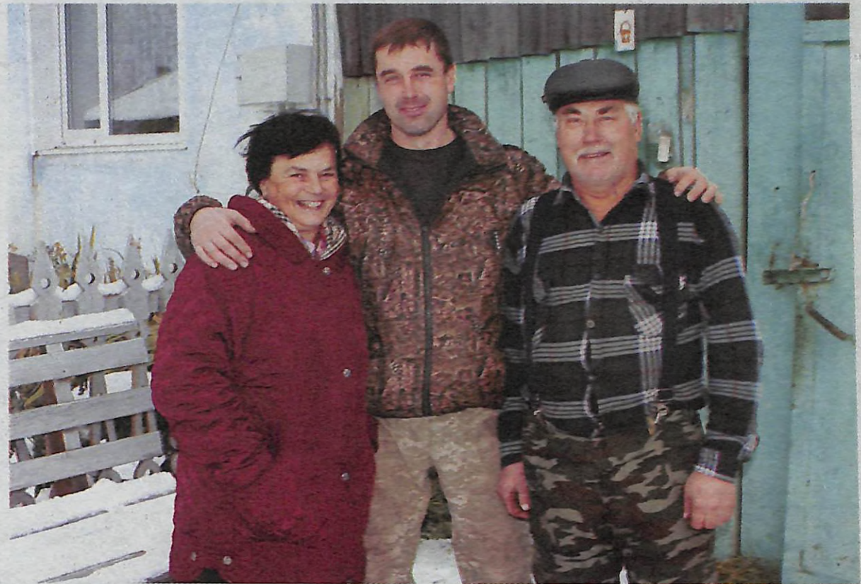
Крепкая семья Когодеевых