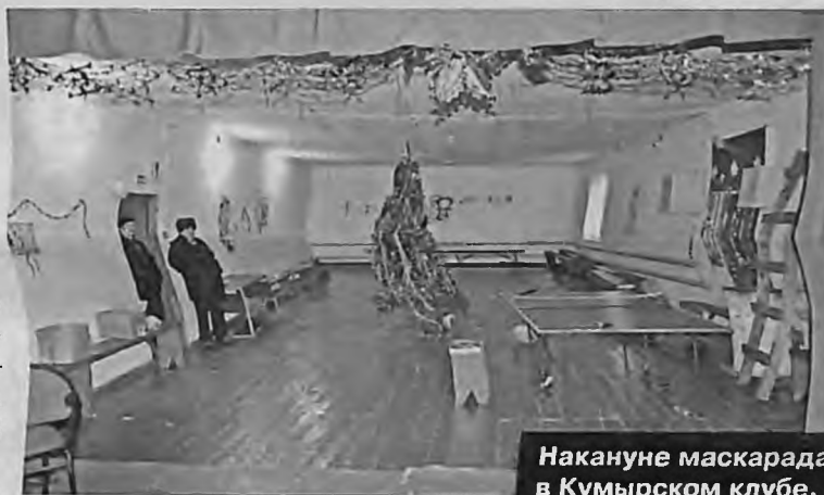
Накануне маскарада в Кумырском клубе.