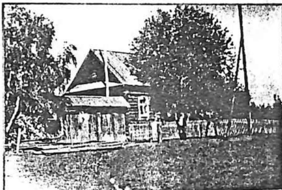
ДОМ В.И. ЛЕКОНЦЕВА В ДЕРЕВНЕ КАМЫШОВКА.

Только что родившемуся младенцу устраивали свадьбу: новорожденный как бы обручался со всем белым светом. Родственники приходили в дом с песнями и вкусным угощением. Ребенку желали долголетия, большого счастья. Уже на следующий день после родов женщина приступала к