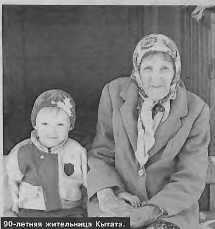
90-летняя жительница Кытата.