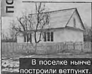
В поселке ныне построили ветпункт.

Нынешний год стал юбилейным для посёлка Кытат. Этому населённому пункту исполнилось 50 лет. Данному событию был посвящён праздник, подготовленный коллективом Кытатского сельского Дома культуры.