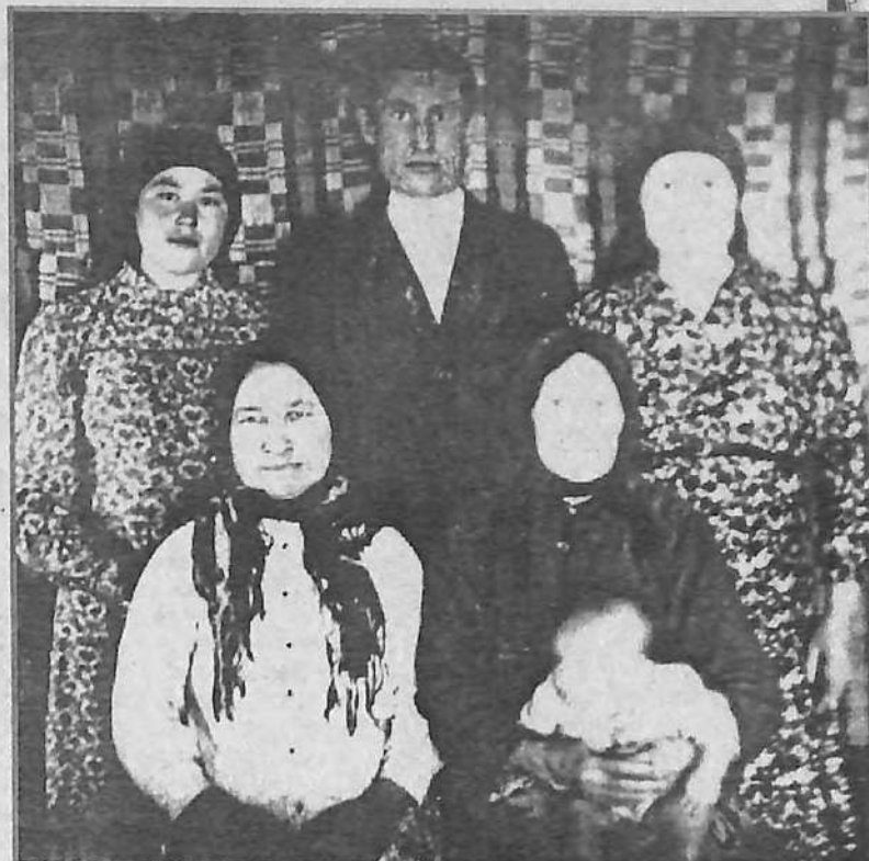
СЕМЬЯ ЛЕКОНЦЕВЫХ (КАМЫШОВКА).

Великие труженики имели, как всякий народ, праздники, когда можно было расслабиться, отдохнуть. Яркие карнавалы, гулянья вотяки устраивали в конце долгой