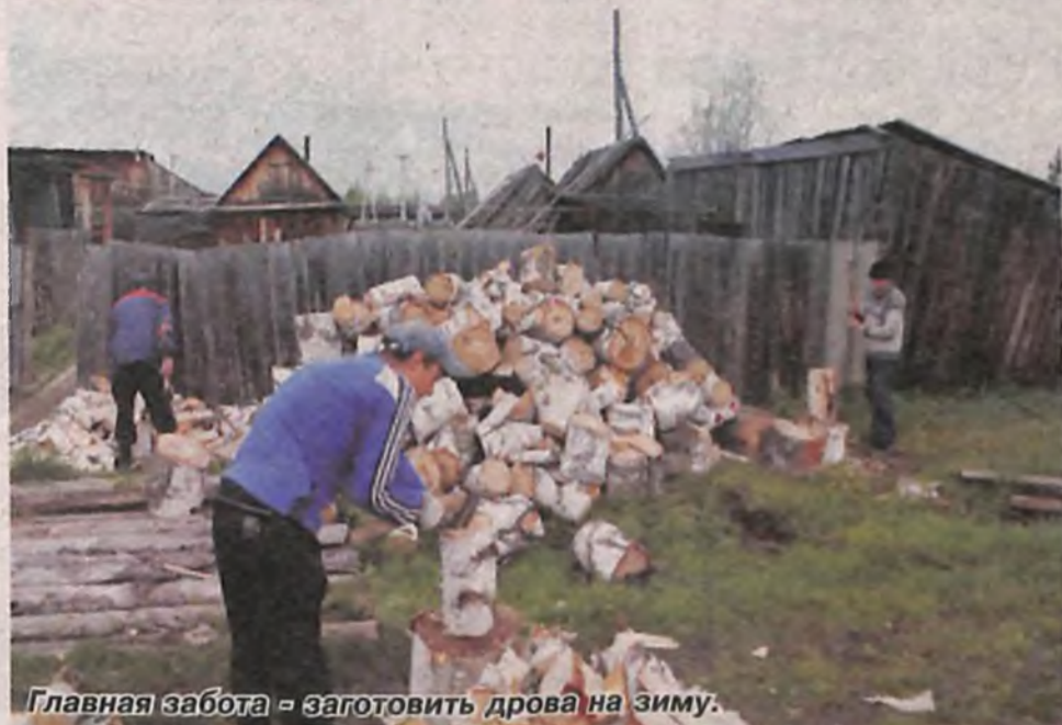
Главная забота - заготовить дрова на зиму.