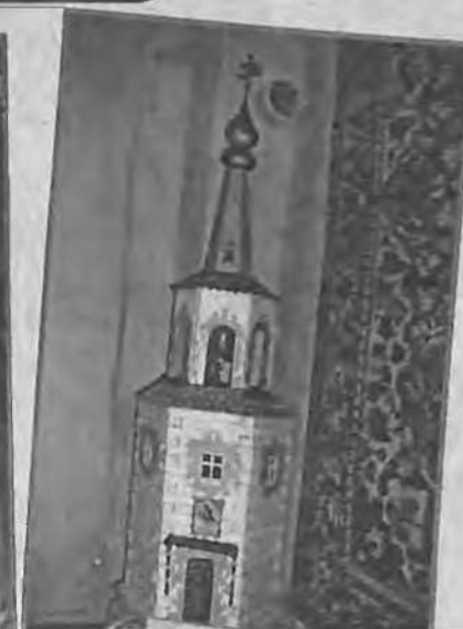
В этом миниатюрном домике, с кружевными занавесками на окнах, даже горит свет. А в часовой установке настоящий колокольчик.