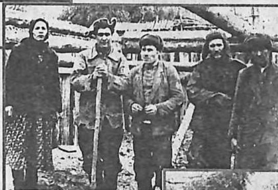
НА СТРОИТЕЛЬСТВЕ ПАСЕКИ.

В 1958 году недалеко от деревни, километрах в пяти,