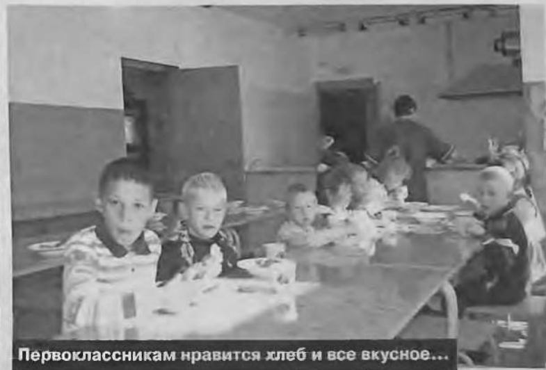
Первоклассникам нравится хлеб и все вкусное...