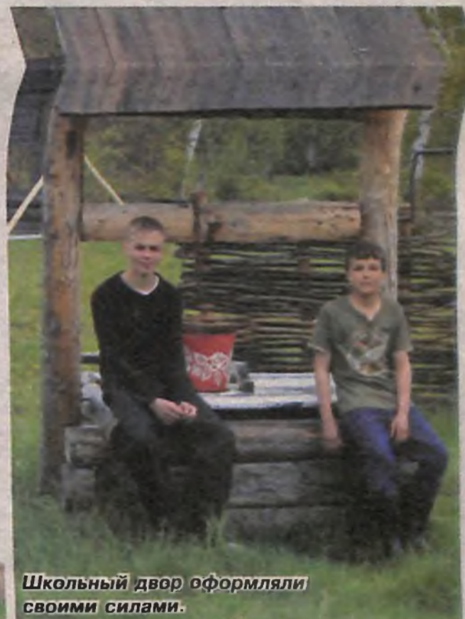
Школьный двор оформляли своими силами.