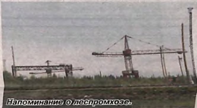
Напоминание о леспромхозе.