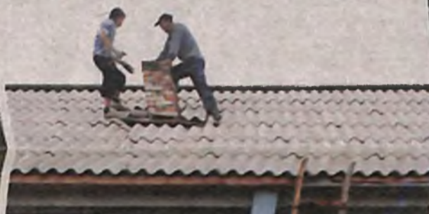
Идет ремонт Кытатского сельского Дома культуры.