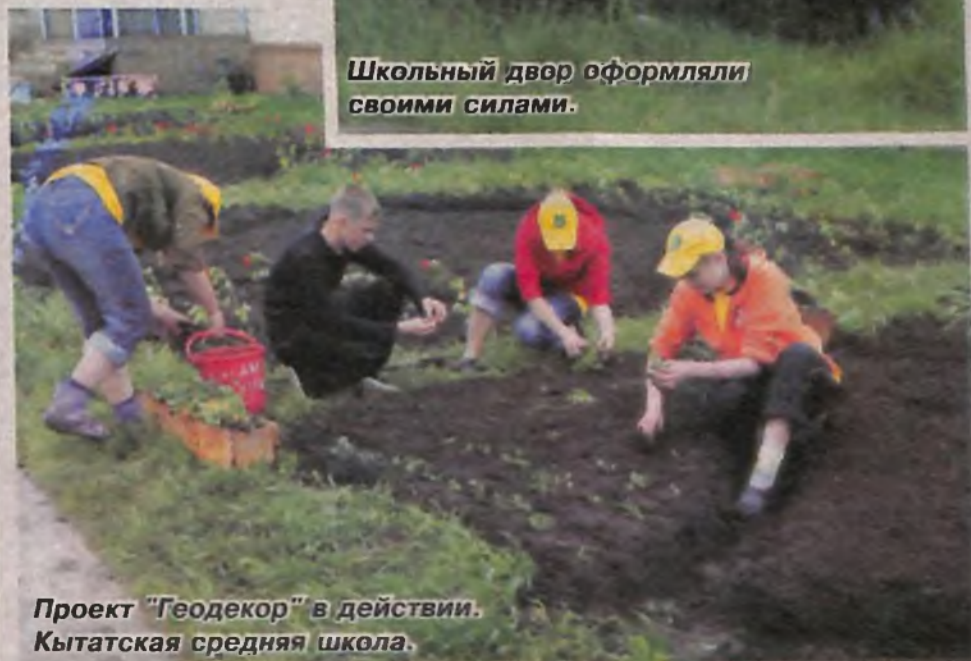
Проект "Геодекор" в действии. Кытатская средняя школа.