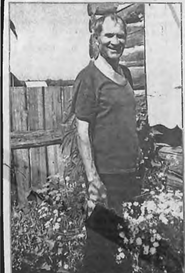
ДАЧНИК, КОТОРЫЙ ЛЮБИТ НАШУ ГАЗЕТУ.