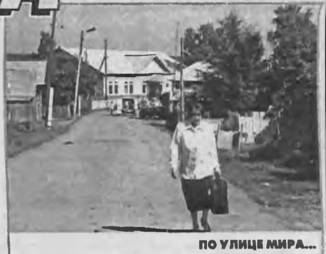
ПО УЛИЦЕ МИРА...