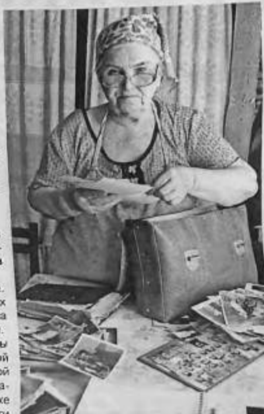
Всплывавшая в старые фотографии...