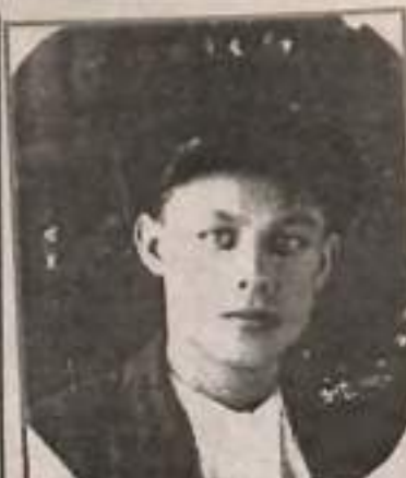
1937 Г. В КАНУН АРЕСТА.

- Как где? Победу встретил на нарах в «Воркутлаге». Я только в 1947 году вернулся из мест заключения. Приехал в Ачинск к жене брата, а его убили на фронте. Ничего этого не знал. Потом домой, в Счастливое. Надо было жизнь начинать. Председатель колхоза попросил меня поучить