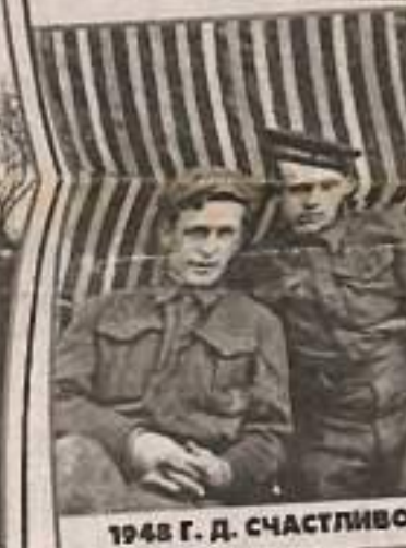
1948 Г. Д. СЧАСТЛИВОЕ...