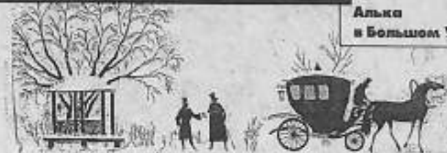
Рисунок Феликса Ветрова.

Наш район славен тем, что в былые годы в нем проживали люди, которые стали впоследствии достаточно известными.