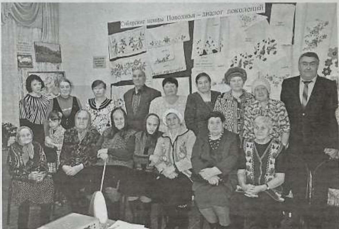
Участники встречи, посвященной Дню памяти жертв политических репрессий.

История 20 века оставила о себе не самые лучшие воспоминания: гражданская война, революция, нестабильность экономики. 1941 год для каждого из нас ассоциируется с началом Великой Отечественной войны. В некоторых семьях этот период ознаменовался еще одной скорбной датой и страшным словом - репрессии.