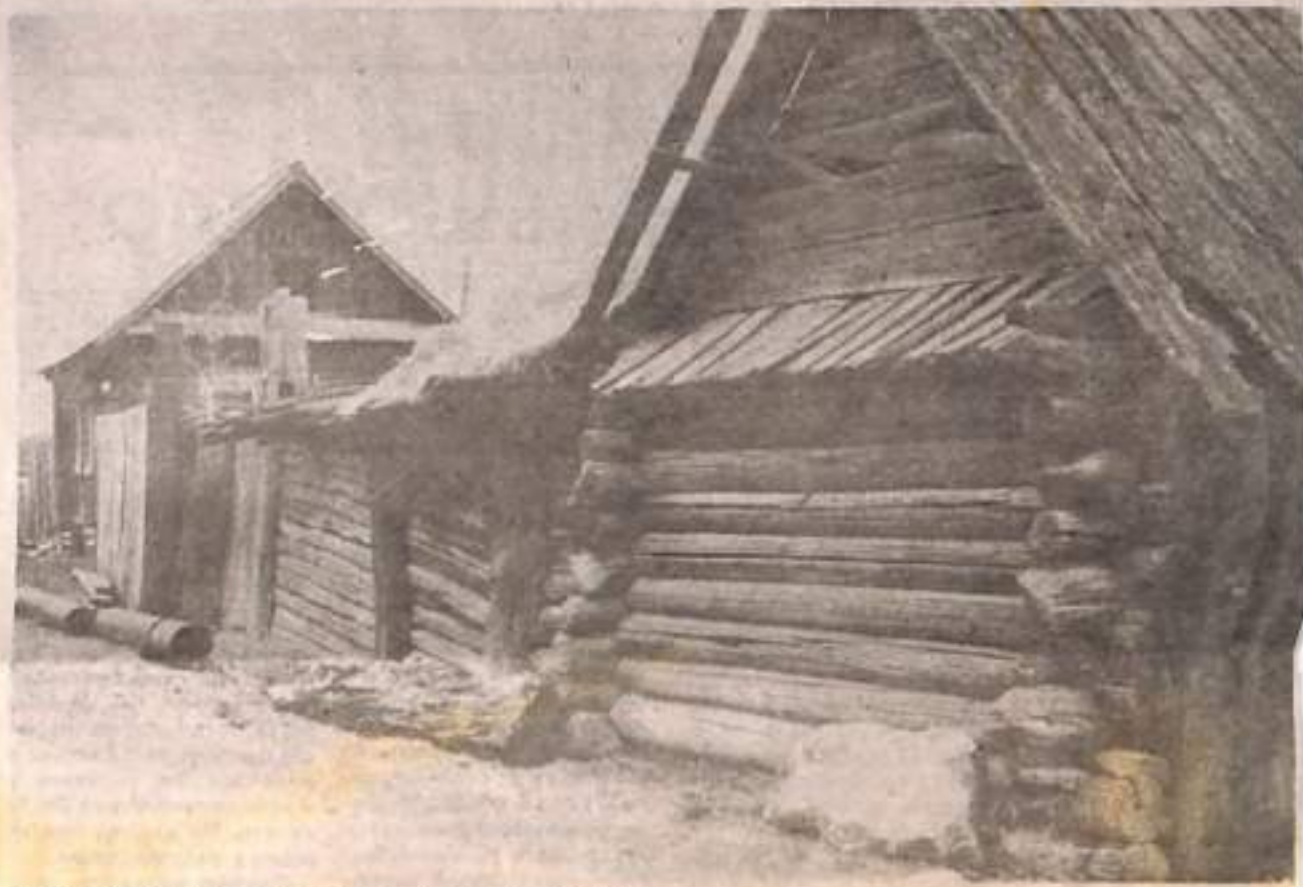
БЕЗМОЛВНЫЙ СВИДЕТЕЛЬ ИЗ ПРОШЛОГО.