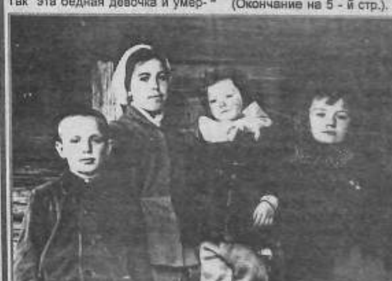
В КРУГУ ВОСПИТАНИКОВ.