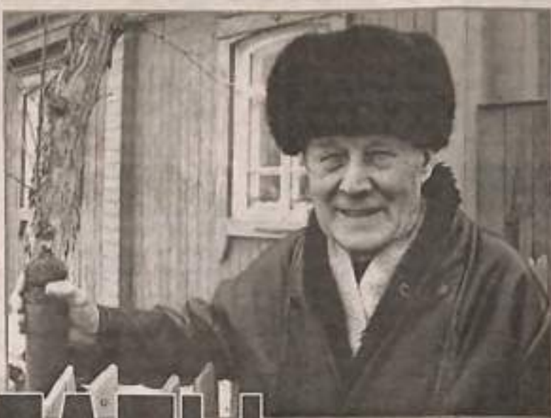
К 235 - ЛЕТИЮ БОЛЬШОГО УЛУЯ

Когда открывалась дверь, все поворачивали головы. Приходила «тройка» НКВД - это и был самый высший наш суд. Обычно по 58-й статье давали десять лет, плюс пять лет поражения в политичес-