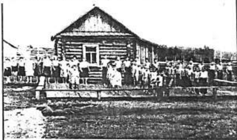
УТРЕННЯЯ ЛИНЕЙКА В БЕРЕЗОВСКОМ ДЕТДОМЕ.

А после войны русские немцы до 1956 года находились под административным надзором. Только в 1976 году им было разрешено возвращение на родину.