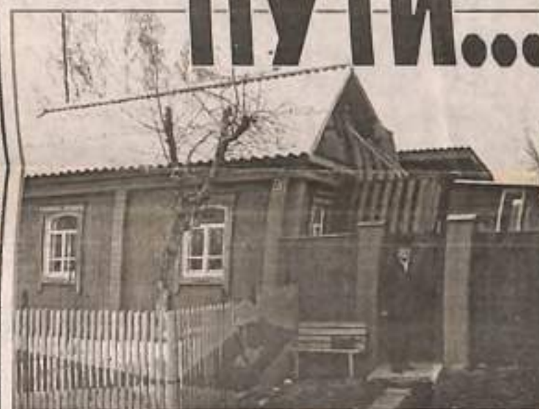
ДОМ НА УЛИЦЕ КАЛИНИНА.