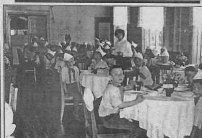
В СТОЛОВОЙ БЕРЕЗОВСКОГО ДЕТДОМА.

стенком пальто шла пожилая женщина. Из-под платка виднелась прядь седых волос. А память подсовывала совсем другой мамин портрет: молодая красивая женщина, в белом беретике, с модной заколочкой на боку!