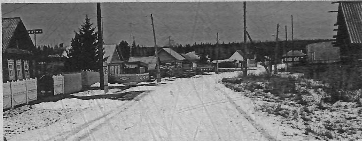
На улицах Турецка

Особенно приятно видеть в деревне уж если не новостройки, то хотя бы дома с признаками современного благоустройства.