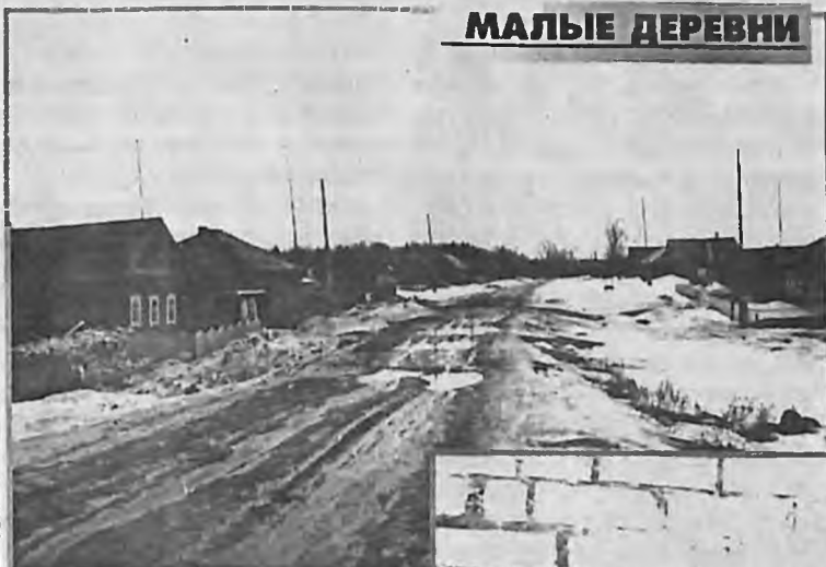
И В НЕПОГОДУ ДОРОГА...

Д олгожданный апрель пока не принес нам заветного тепла и обновления природы. На дорогах замерзшие лужи, снег.