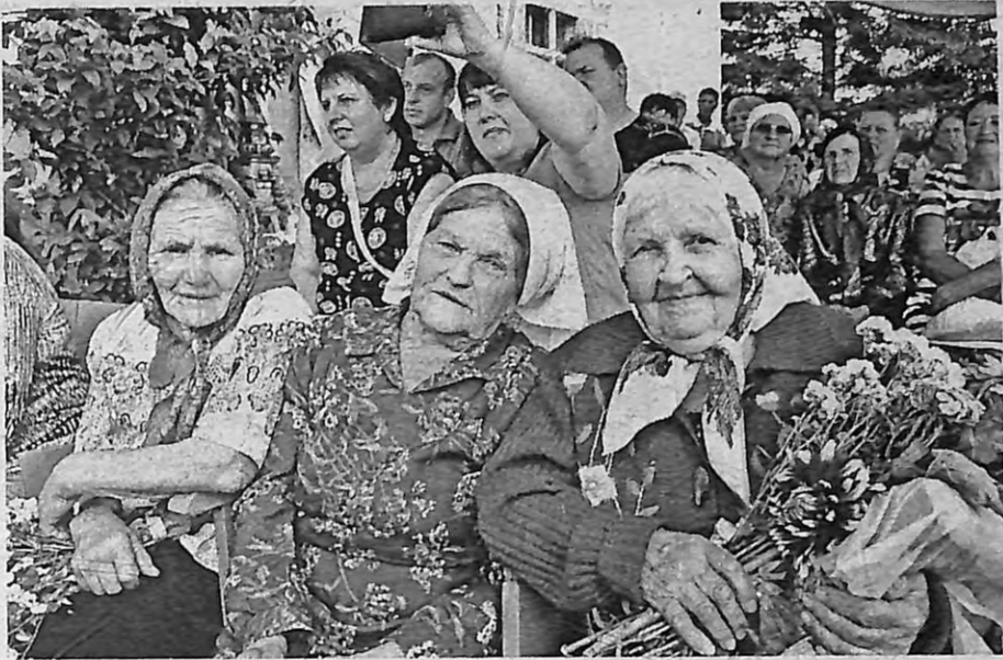
Подруги и... песня. Участницы фольклорной группы восьмидесятых.