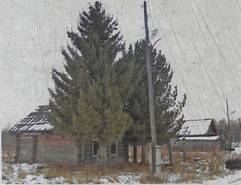
Дом, где никто не живёт...

— Мама и думать не собирается о переезде в мою семью. Мы с женой постоянно зовём её к себе. Но она упрямо твердит, если приедет сюда, то быстро уйдёт из жизни. Так, мол, все старые люди говорят: нужно жить только в родных стенах, насколько