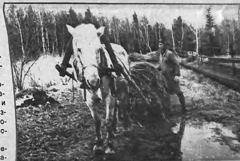
ХОТЬ НА ДВОРЕ УЖ НОВЫЙ ВЕК...